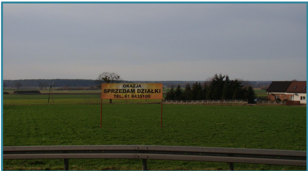
Rysunek 16 – Działki nr 24/1, 24/2, 24/3, 24/4, 24/7, 24/8, 24/9, 24/10, 24/11, 24/12 - zdjęcie