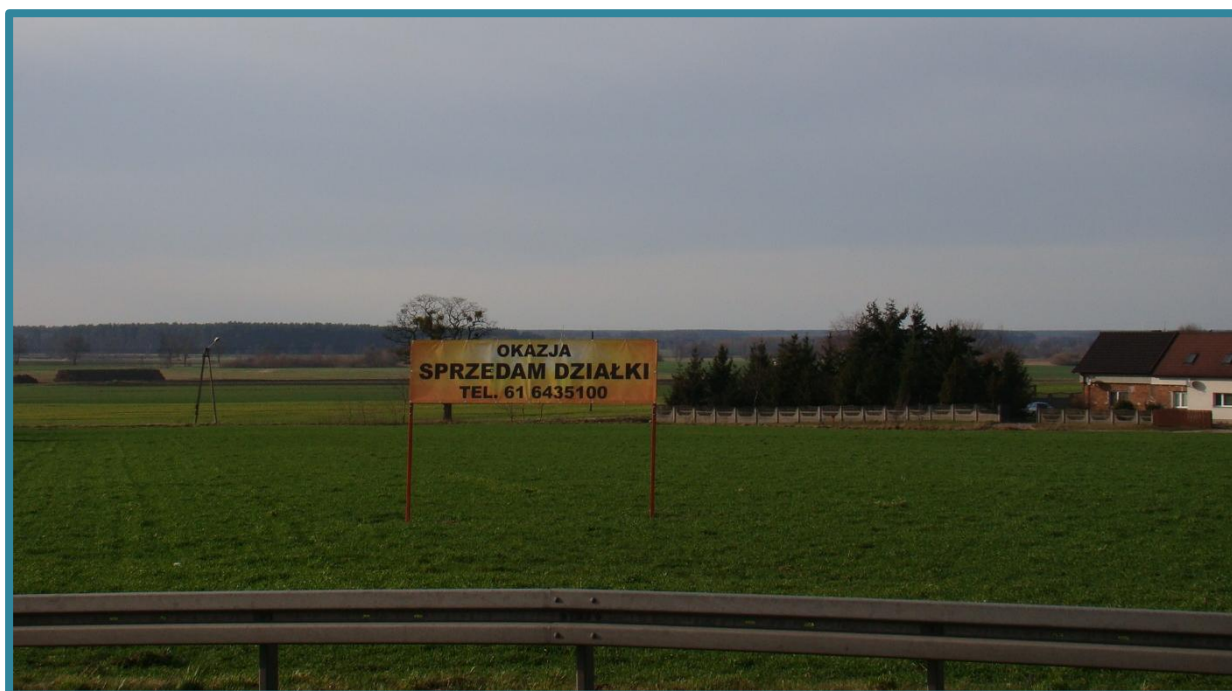
Rysunek 16 – Działki nr 24/1, 24/2, 24/3, 24/4, 24/7, 24/8, 24/9, 24/10, 24/11, 24/12 - zdjęcie